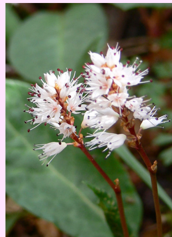
写真は 大分県由布市・男池(九重山麓)

ハルトラノオはタデ科で、山地の木陰に生える多年草。本州、四国、九州に分布。花は茎の先端につける総状花。白いのは萼(がく)で花弁はない。イロハソウとも呼ばれる。早春にいち早く咲くので、イロハ四十七文字の最初のイロハにたとえて、その名が付いた。(坪)