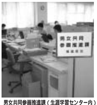
男女共同参画推進課（生涯学習センター内）

議員 筑紫野市は、平成十五年に「男女共同参画都市宣言」を行い、今年度には「男女共同参画に向けた条例」が制定