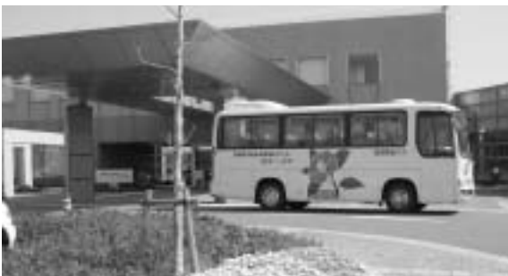
総合保健福祉センター（カミリーヤ）