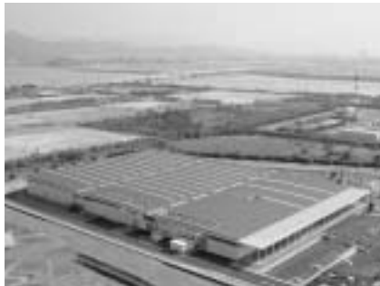
福岡地区水道企業団の海水淡水化施設

算の収益的収入、第一款第一項営業収益の額と予算に関する説明書を修正するものです。委員会では、修正案に対する質疑、討論を行い、採決の結果、全員一致、原案を一部修正して可決すべきものと決しました。